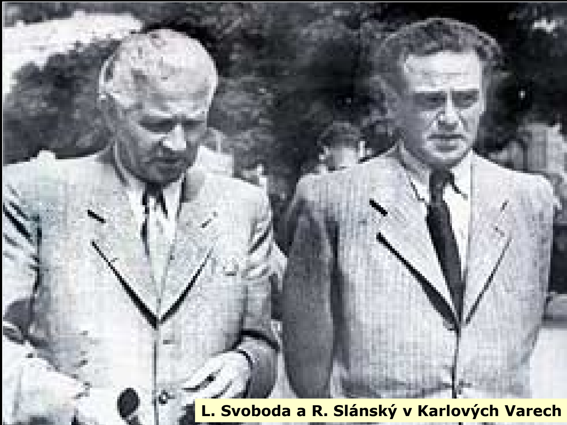
L. Svoboda a R. Slánský v Karlových Varech