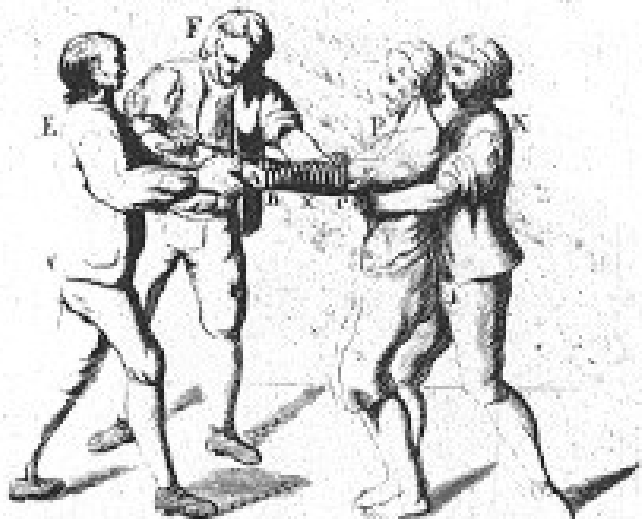
Erklärung der Buchstaben.

Eigentlicher Entwurf, der die Anlegung des Grads der Schürung mit den nöthigen Personen besteht.