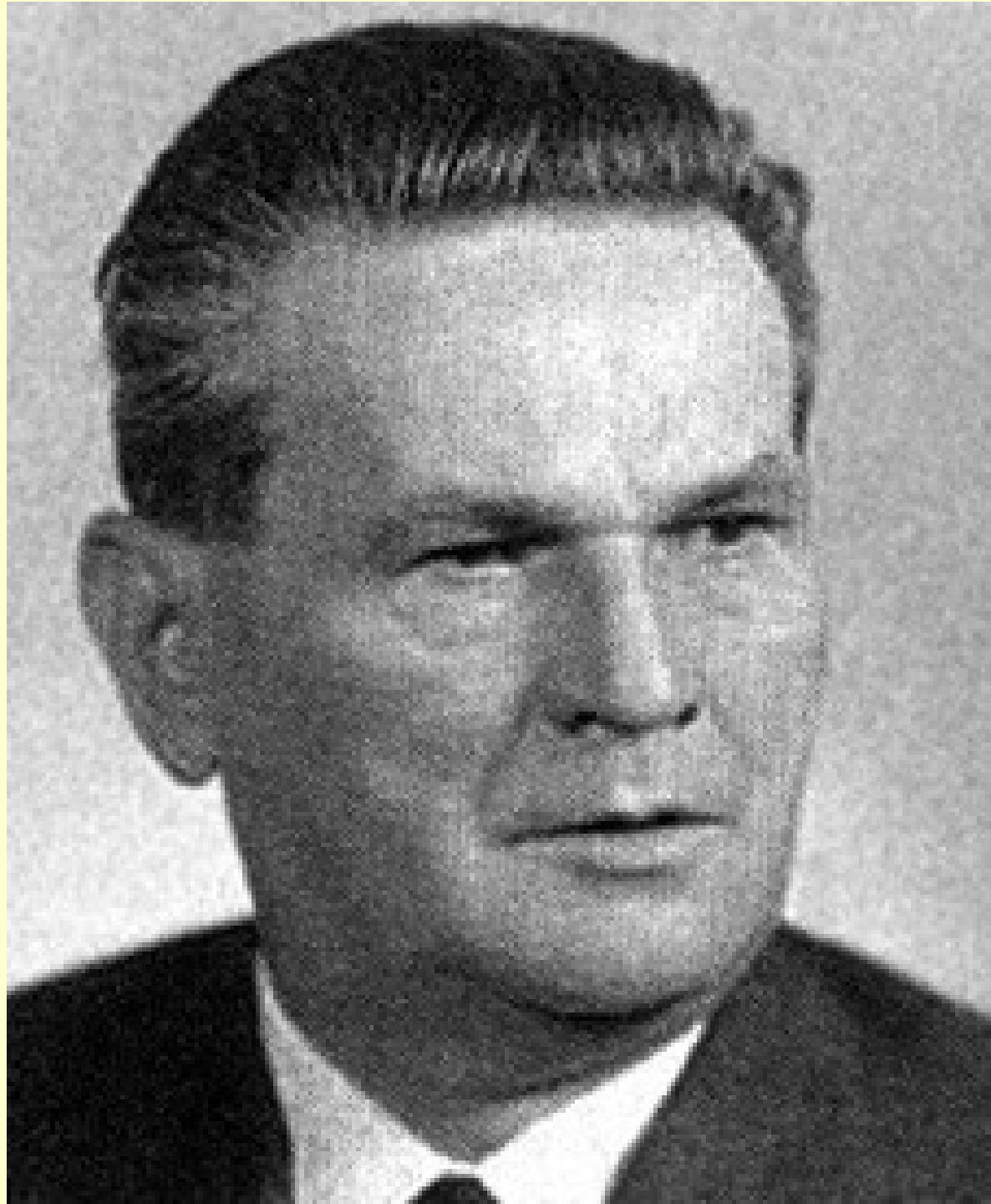
Viliam Široký 1902 - 1971