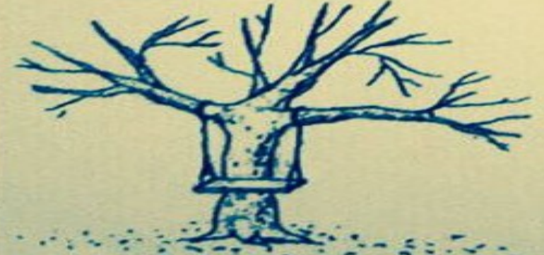
PROVEDENO STAVEBNÍ FIRMOU