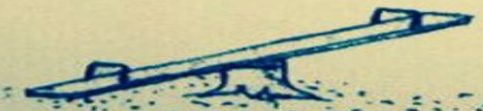
PO ODSTRÁNĚNÍ VAD A NEDODĚLKŮ