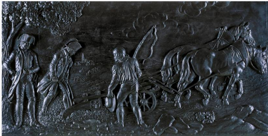
Josef II. orající na poli u Slavíkovice (1769-1836-1921-1995-2010)

celkem pět různých pomníků (selský 1769/70, knížecí 1770, stavovský 1804-09 a 1835-36, 1995)