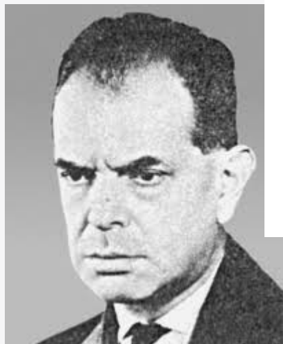
Viktor Knapp (1913–1996)