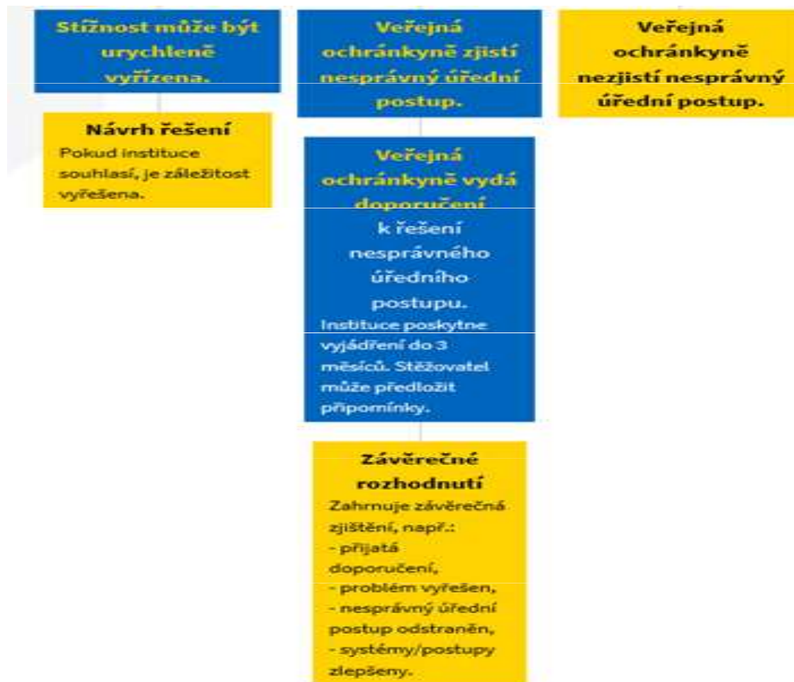
Schéma postupu při vyřizování stížnosti II - šetření