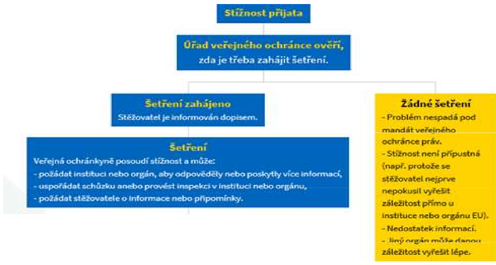
Schéma postupu při vyřizování stížnosti I