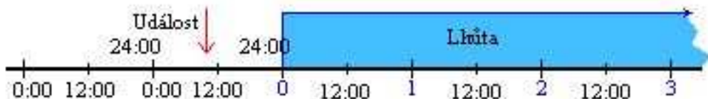
Obrázek 1 - Počátek běhu lhůt

Lhůta počíná běžet dnem (počátkem – 0:00 hod) následujícím od rozhodné události (§ 122/1 OZ, § 266 odst. 1 ZP, § 57 odst. 1 OSŘ, § 60 odst. 1 TŘ, § 40 odst. 1 písm. a) SŘ, § 40 odst. 1 SŘS, § 14 odst. 6 ZSDP, § 128 odst. 1 ZSZ).