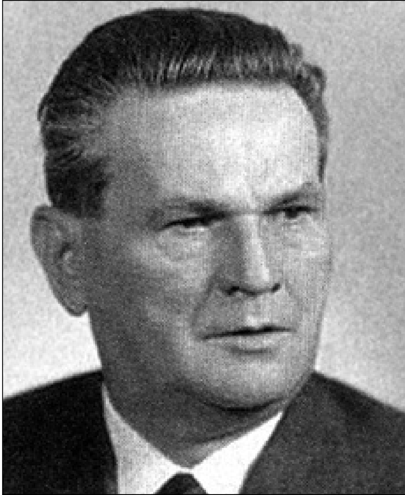
Viliam Široký (1902 – 1971)