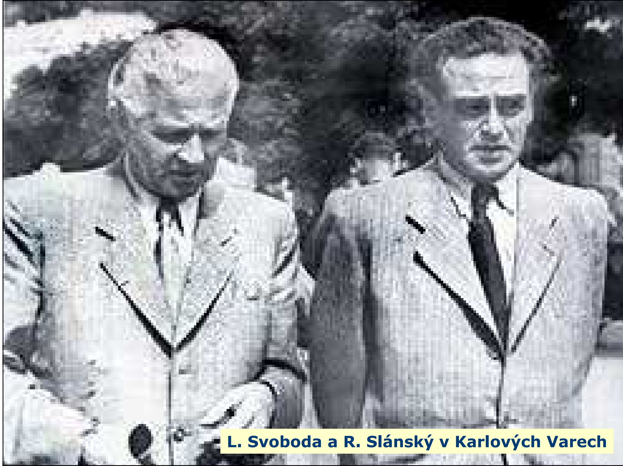
L. Svoboda a R. Slánský v Karlových Varech