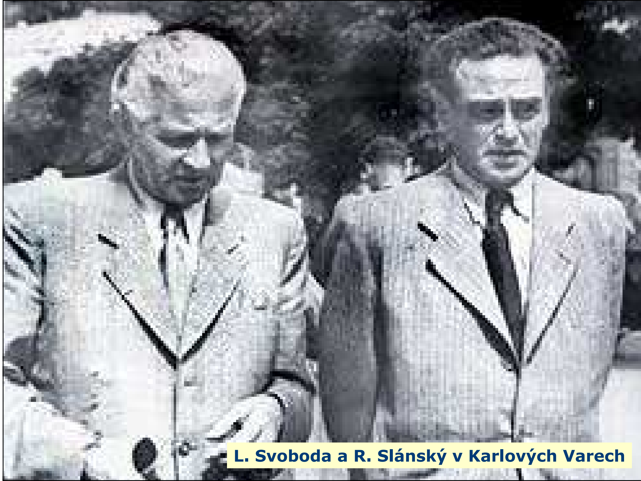
L. Svoboda a R. Slánský v Karlových Varech