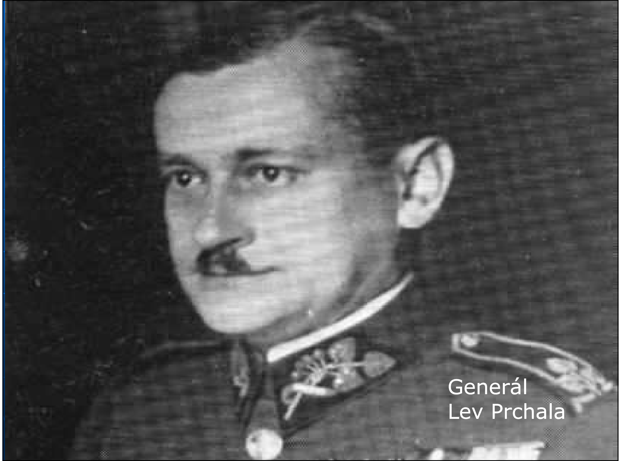
Generál Lev Prchala