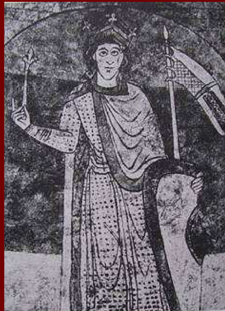
Král Vratislav II. (1061—92) Rotunda sv. Kateřiny, Znojmo, detail fresky z r. 1134