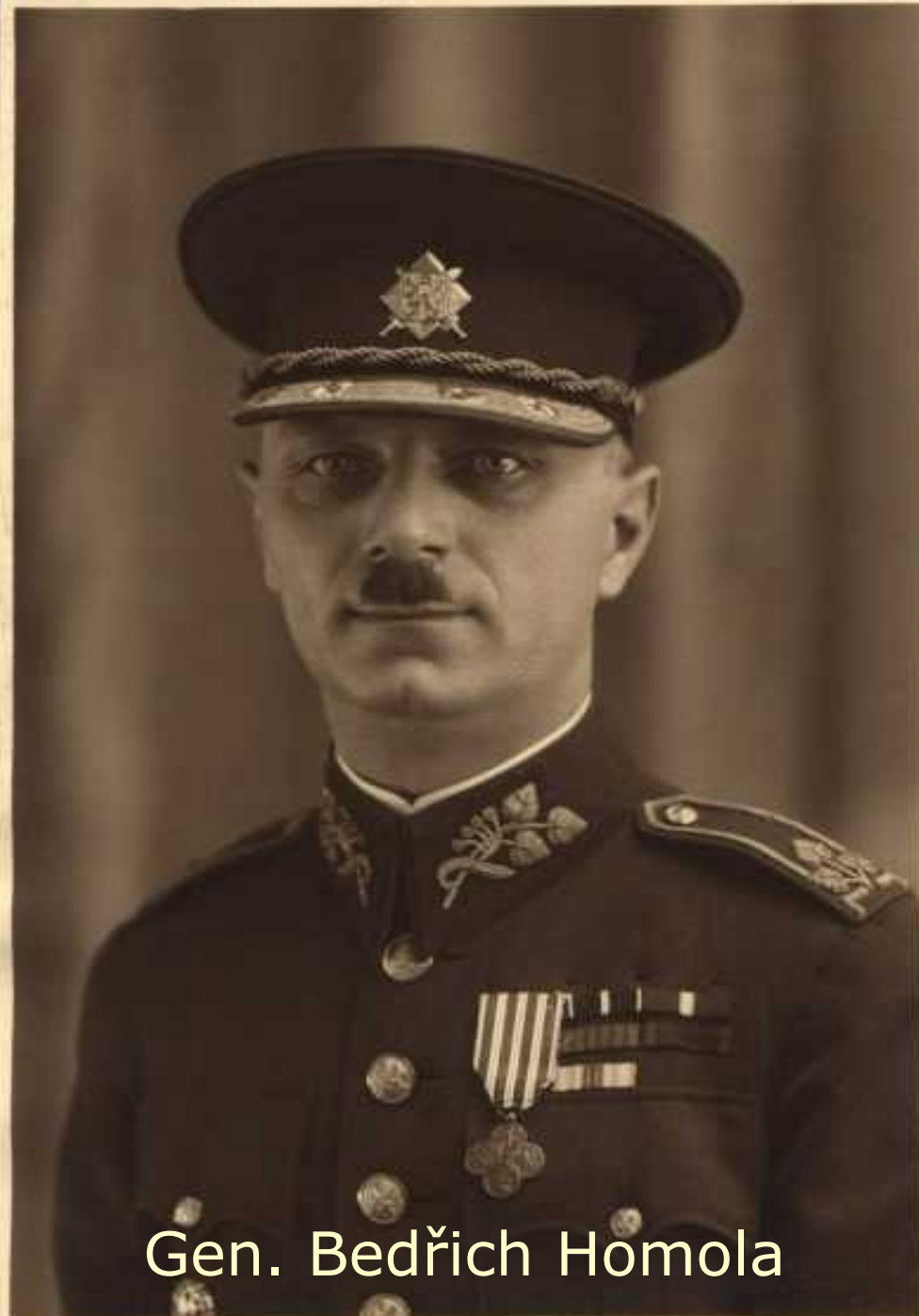
Gen. Bedřich Homola