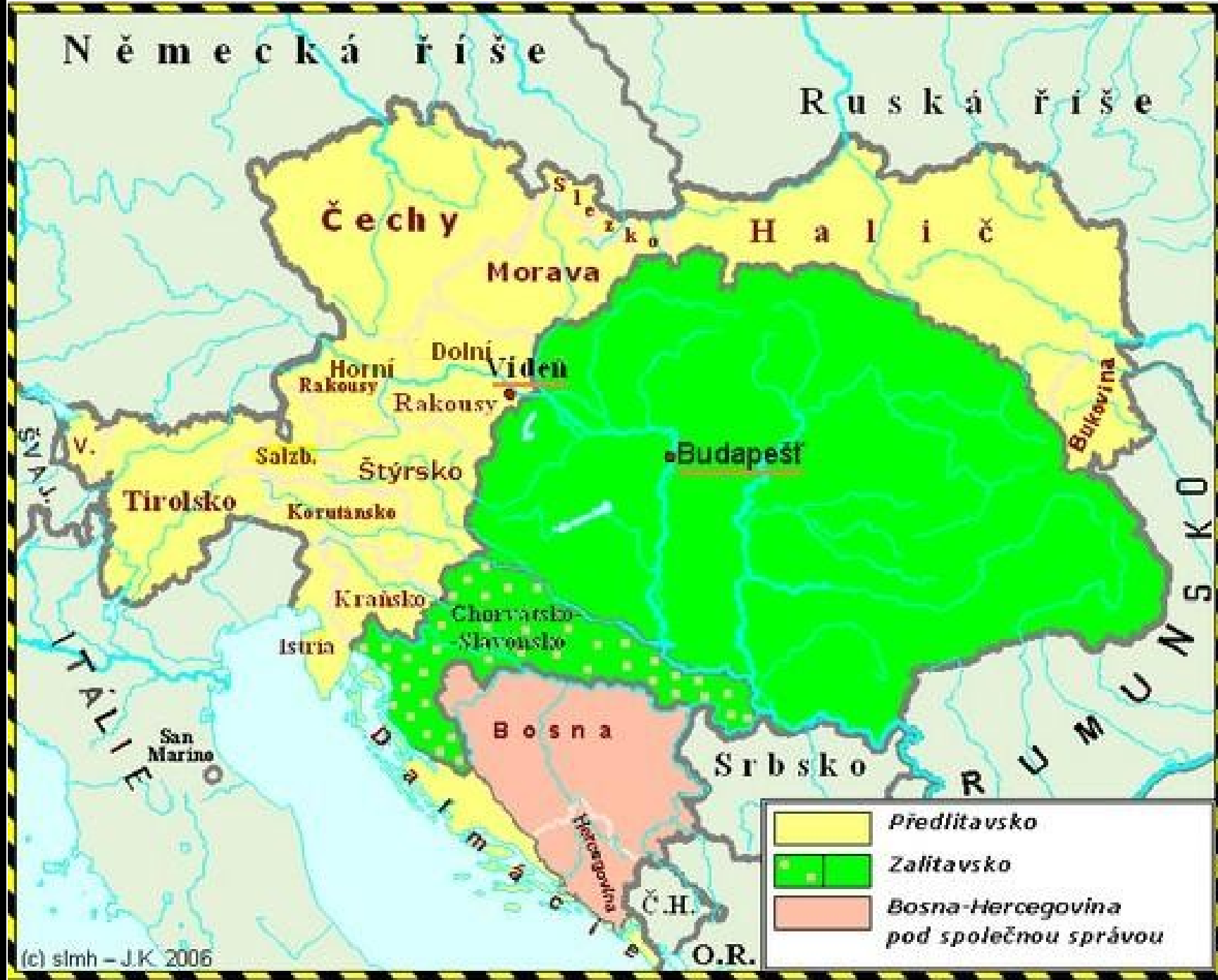
(c) slmh - J.K. 2006