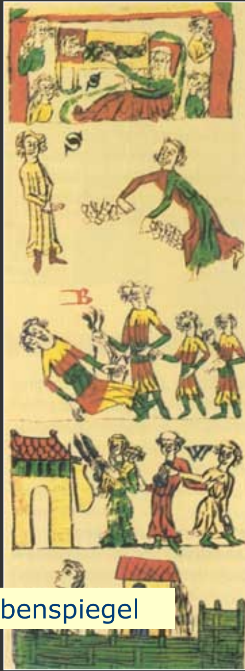
Sachsenspiegel a Schwabenspiegel