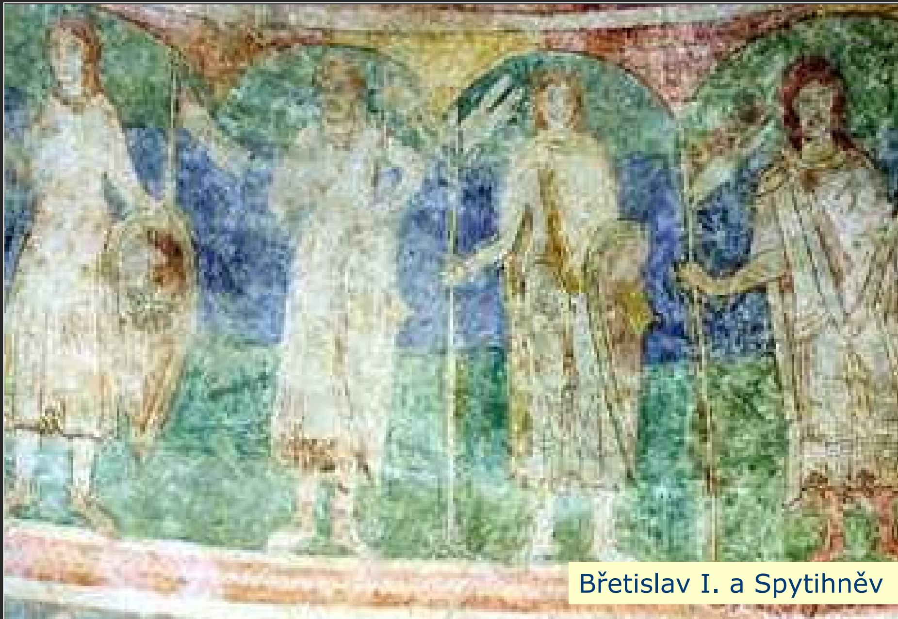
Břetislav I. a Spytihněv