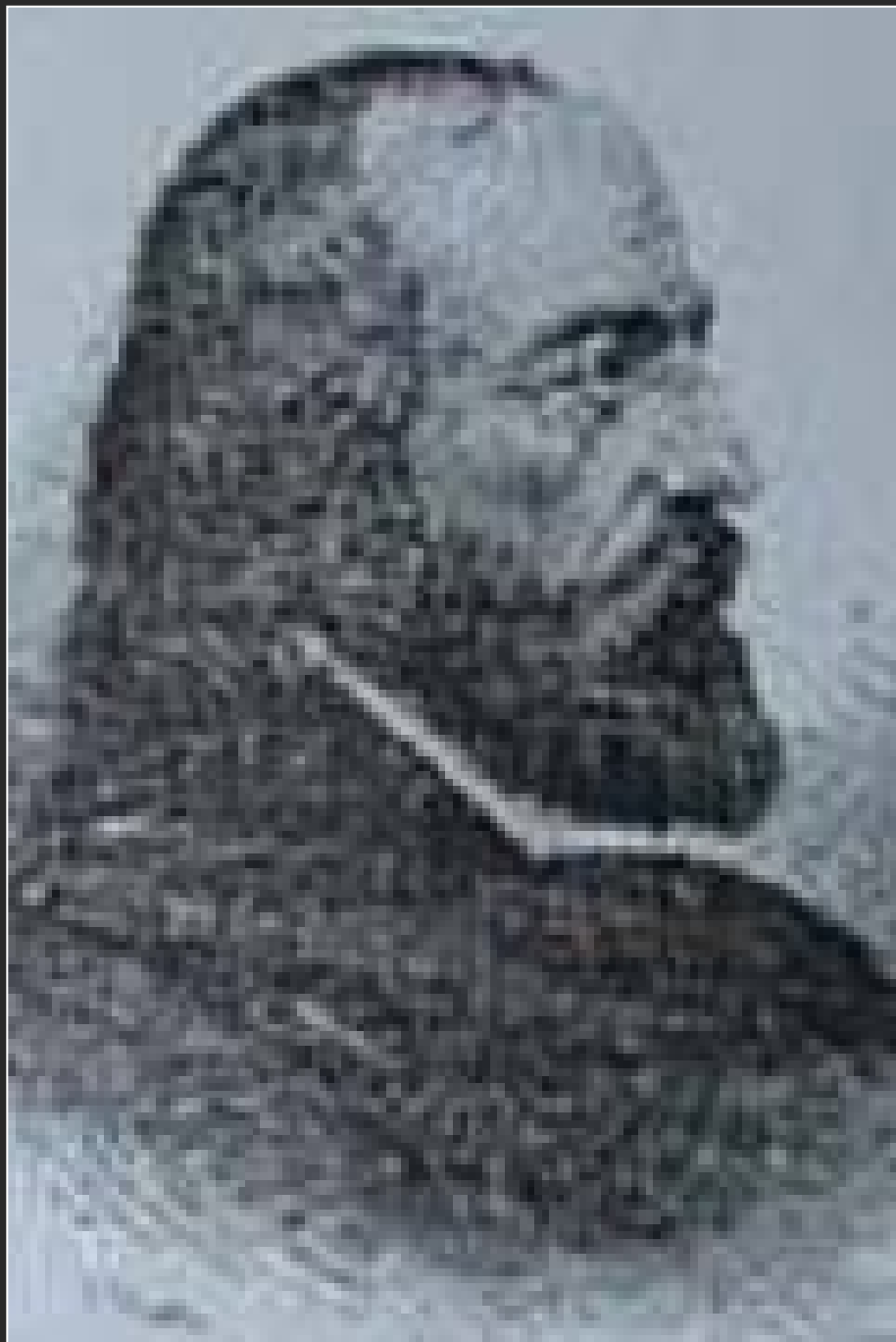
Viktorin Kornelius ze Všehrd