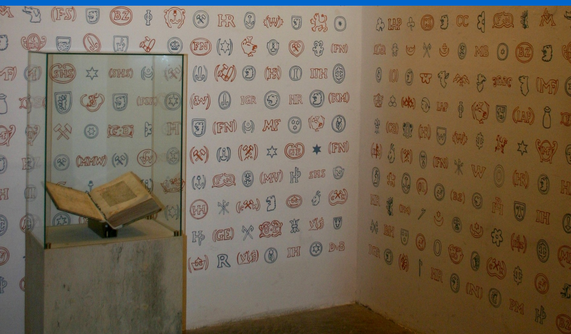
Vlašský dvůr v Kutné Hoře