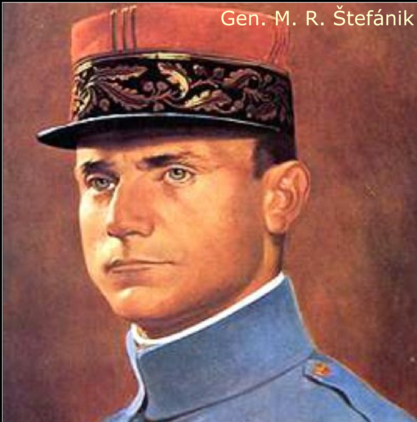
Gen. M. R. Štefánik