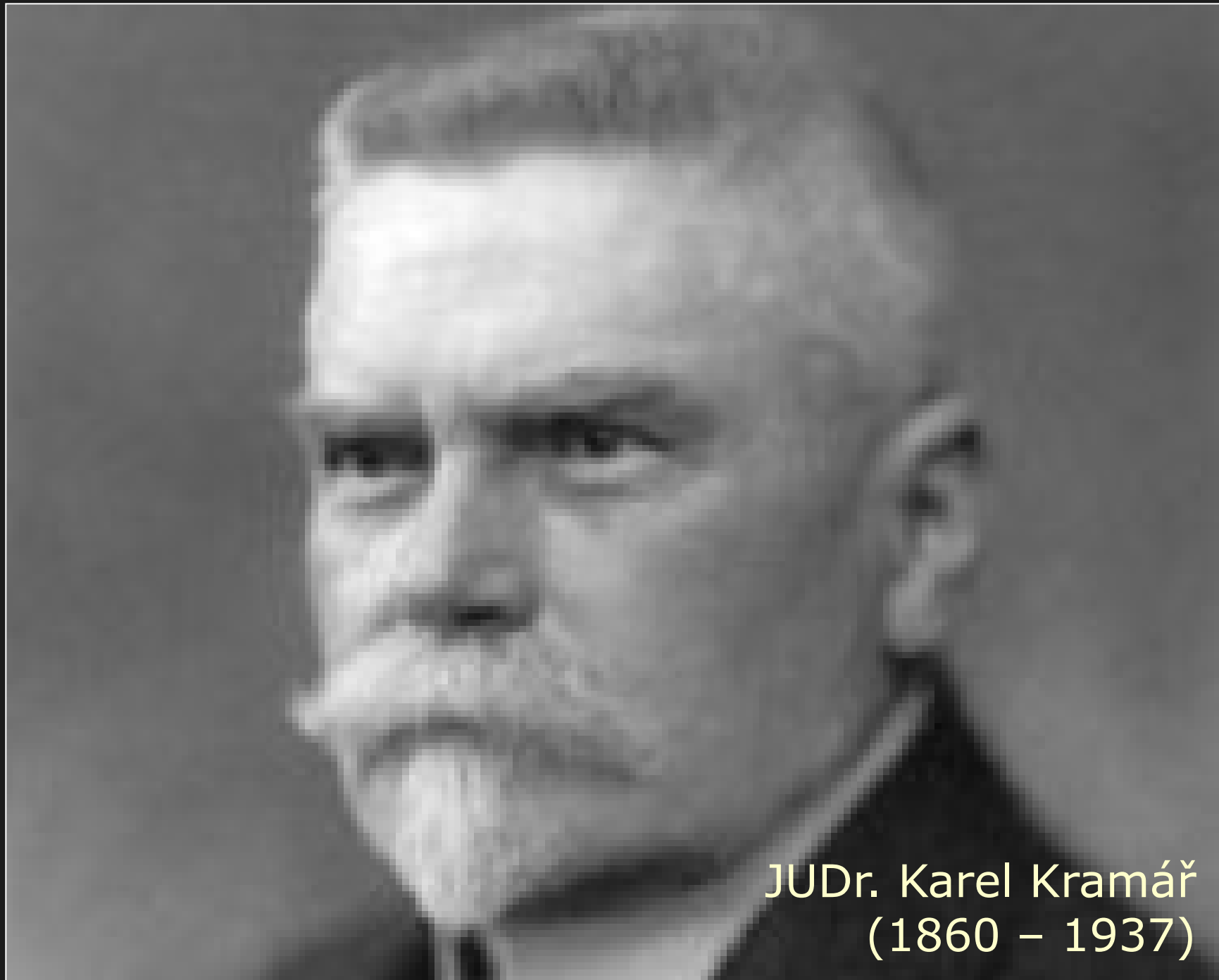
JUDr. Karel Kramář (1860 – 1937)