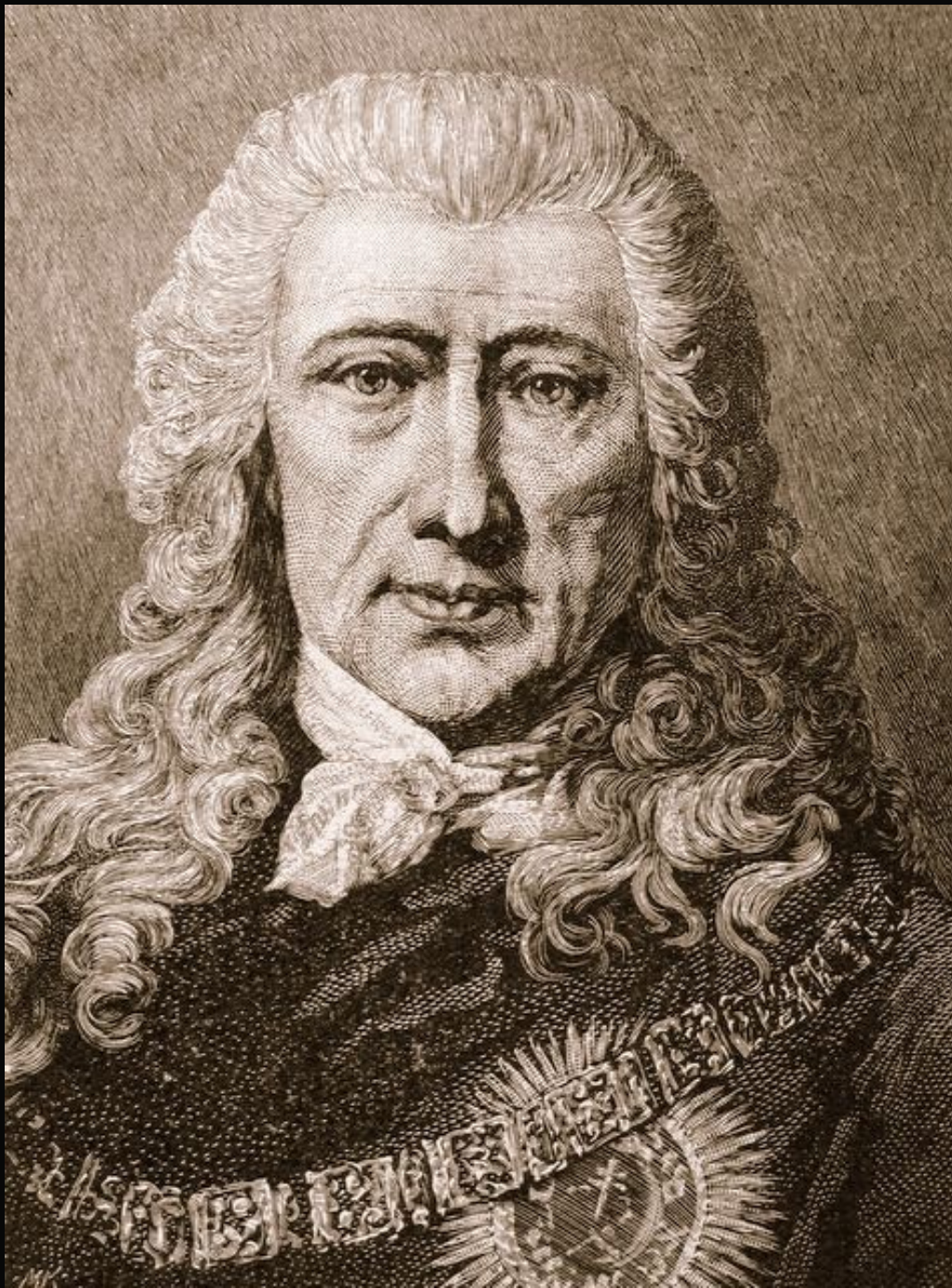
Kníže Václav Antonín Kaunitz (1711-1794)