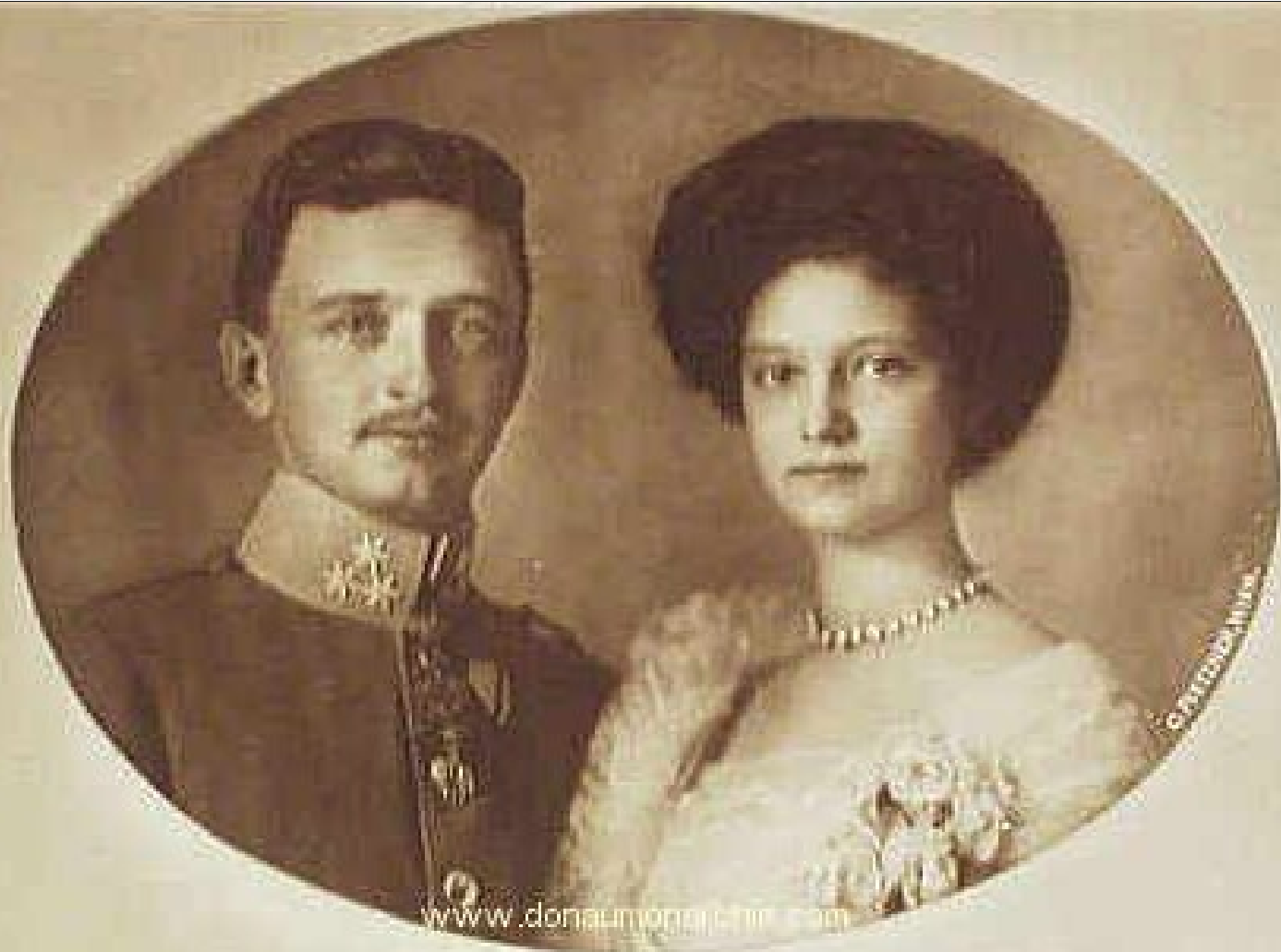
1895 1895 1895 Kaiser Karl u. Kaiserin Sisi