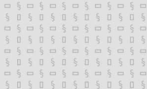
MAPKA z 8. 10. 2010