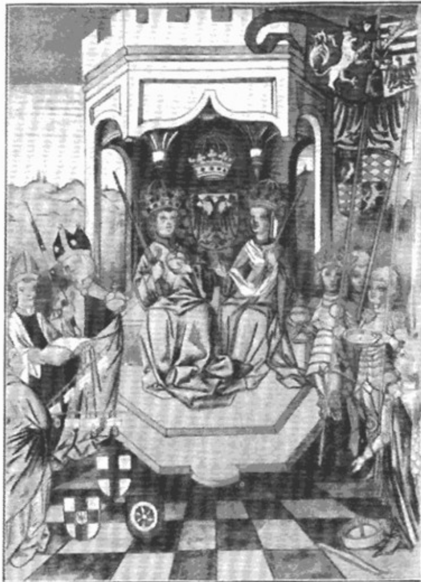
Kaiser Karl IV. die goldne Bulle erteilend. (Aus der Handschrift der goldnen Bulle in der herzogl. Bibliothek zu Wolfenbüttel.)