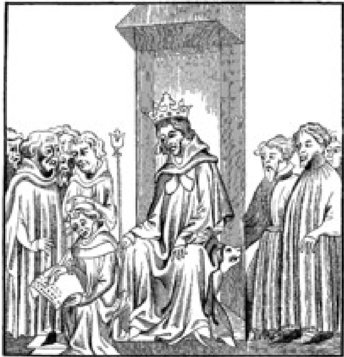
Fig. 1.—The King of the Franks, in the midst of the Military Chiefs who formed his Throuse , or armed Court, dictates the Salic Law (Code of the Barbaric Laws).—Fac-simile of a Miniature in the "Chronicles of St. Denis," a Manuscript of the Fourteenth Century (Library of the Arsenal).