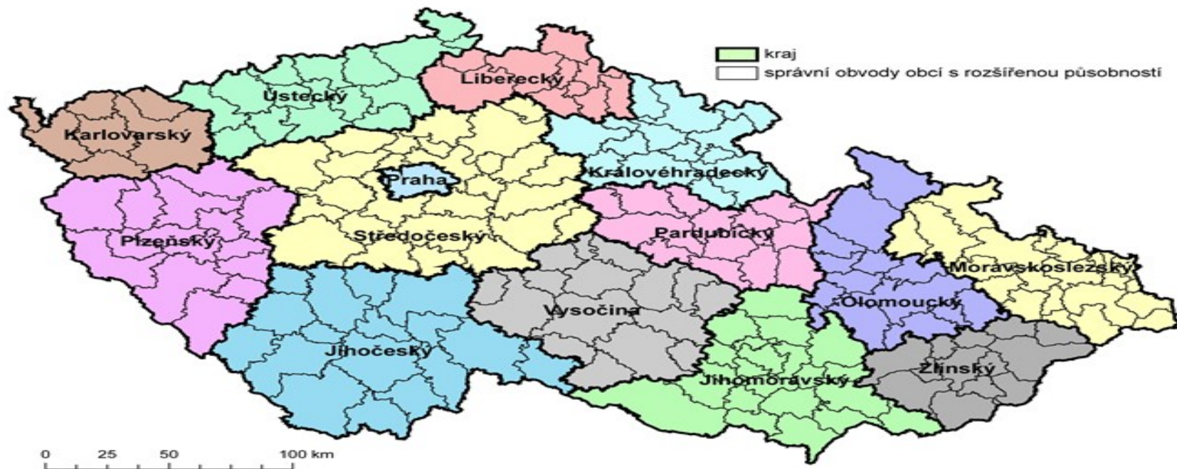
Územně správní členění České republiky