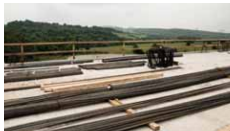
Dálnice D8, Stavba 0805 Lovosice - Řehlovice, část A - trasa dálnice A 215 - Dálniční most přes sil. III/258 29 ŽIM - Řehlovice