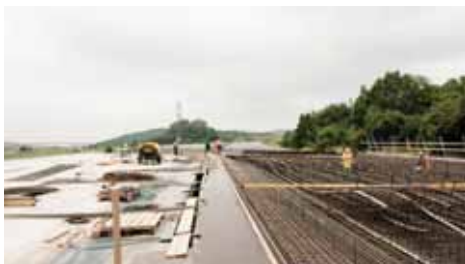
Dodávka betonářské oceli pro společnost STAV-TECH-CAR