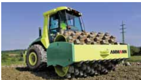
Dodávky plechů na výrobu stavební techniky Ammann Czech Republic