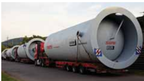
Dodávka plechů v jakosti P355GH pro firmu Kasper Kovo s.r.o.