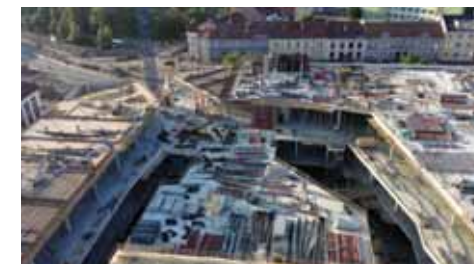
AUPARK Hradec Králové