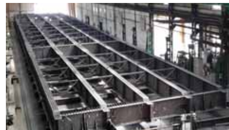
Dodávka plechů pro společnost Firesta-Fišer