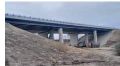
Most pro město Měřín