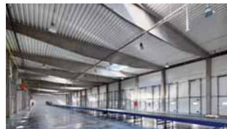
Dodávka betonářské oceli firmě H.A.N.S. stavby a.s.