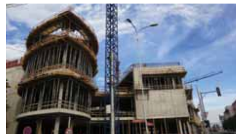
Dodávky betonářské oceli pro firmu FERI, s.r.o. Hradec Králové.