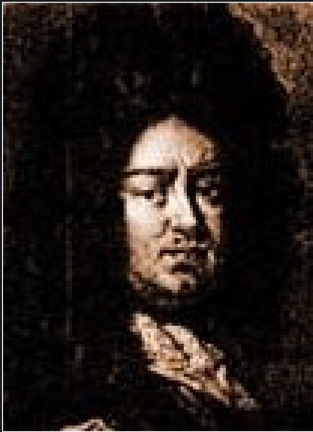
Ch. Thomasius (1655 – 1728)