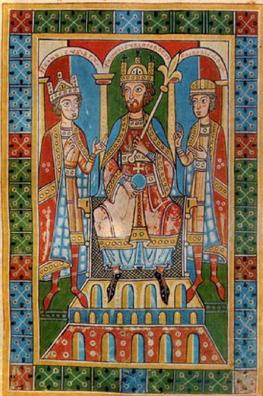
Friedrich Barbarossa se svými syny