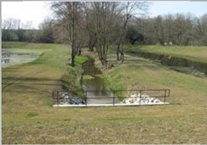
Území určená k rozlivům povodní