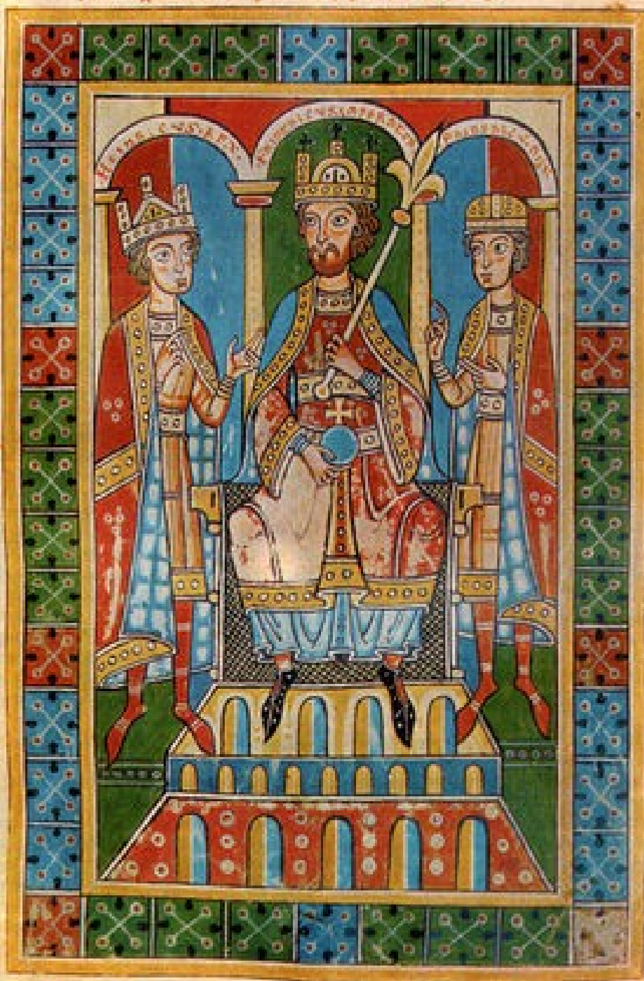
Friedrich Barbarossa se svými syny

Innoentio papa pater 1077 1111 1111 1111