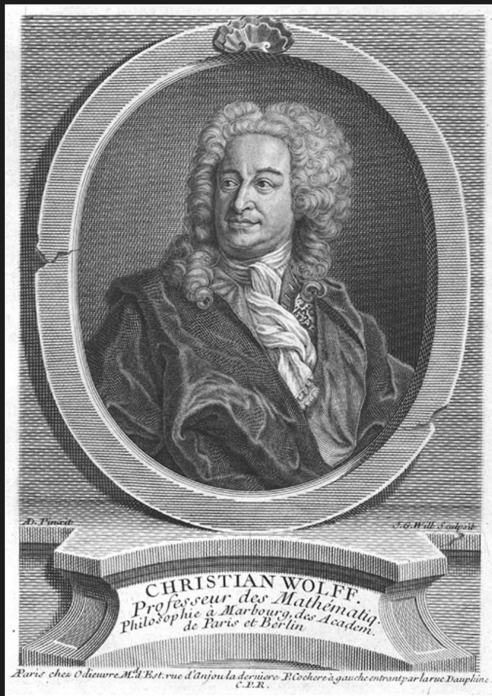
Ch. Wolff (1679 – 1754)