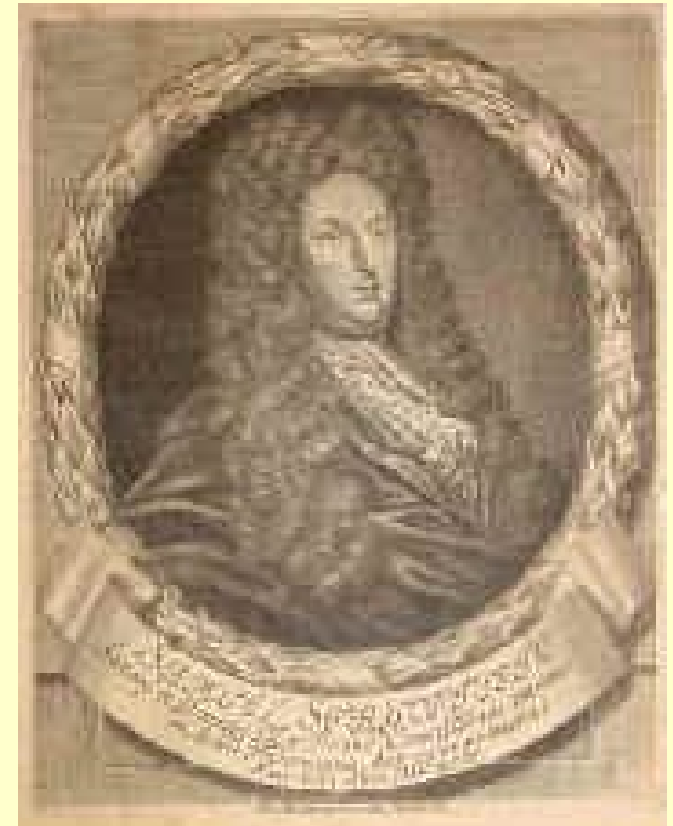
Samuel Stryk (1640 - 1710)