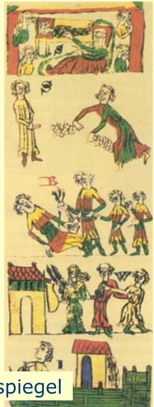
Sachsenspiegel a Schwabenspiegel