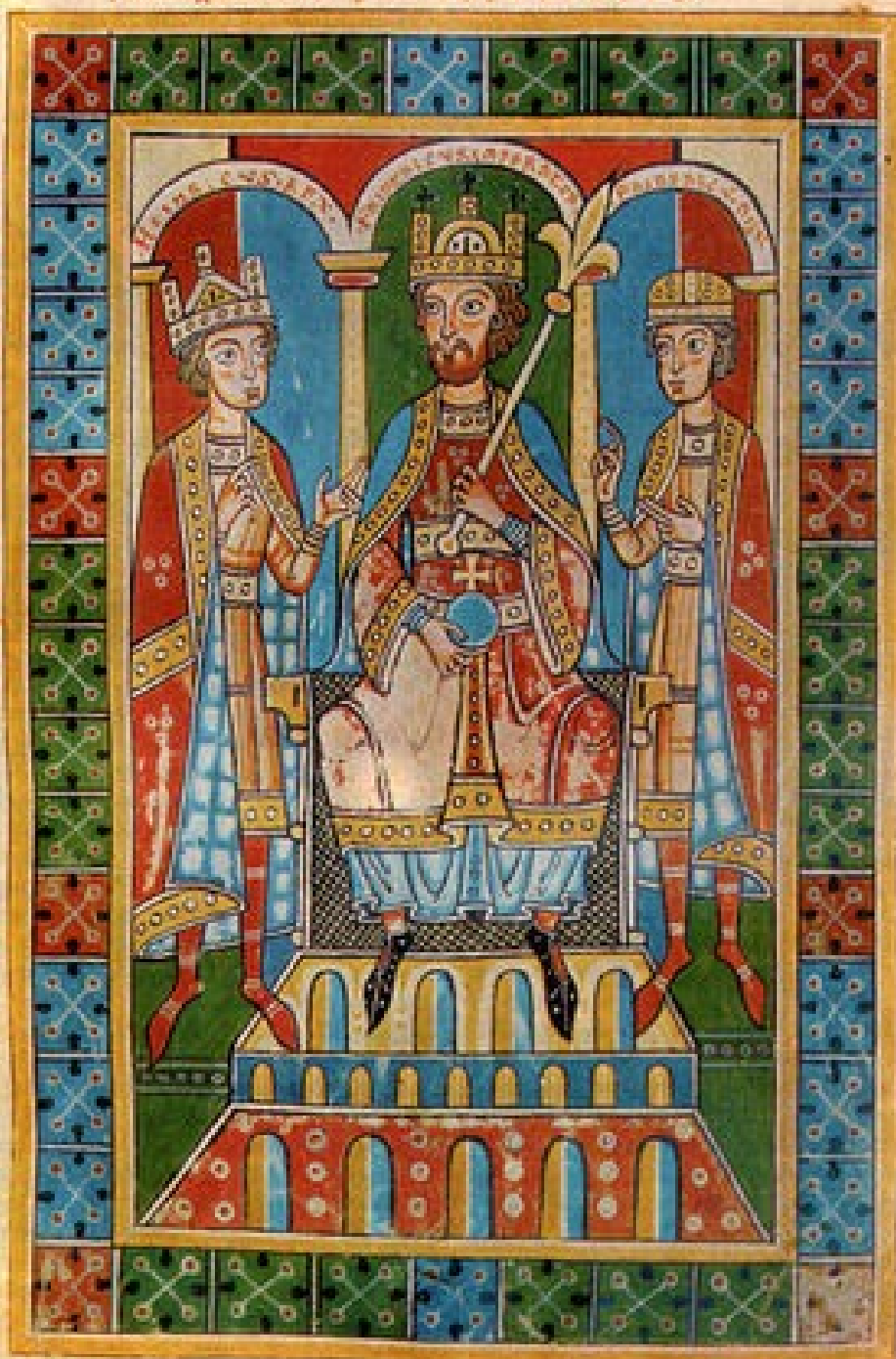
Friedrich Barbarossa se svými syny