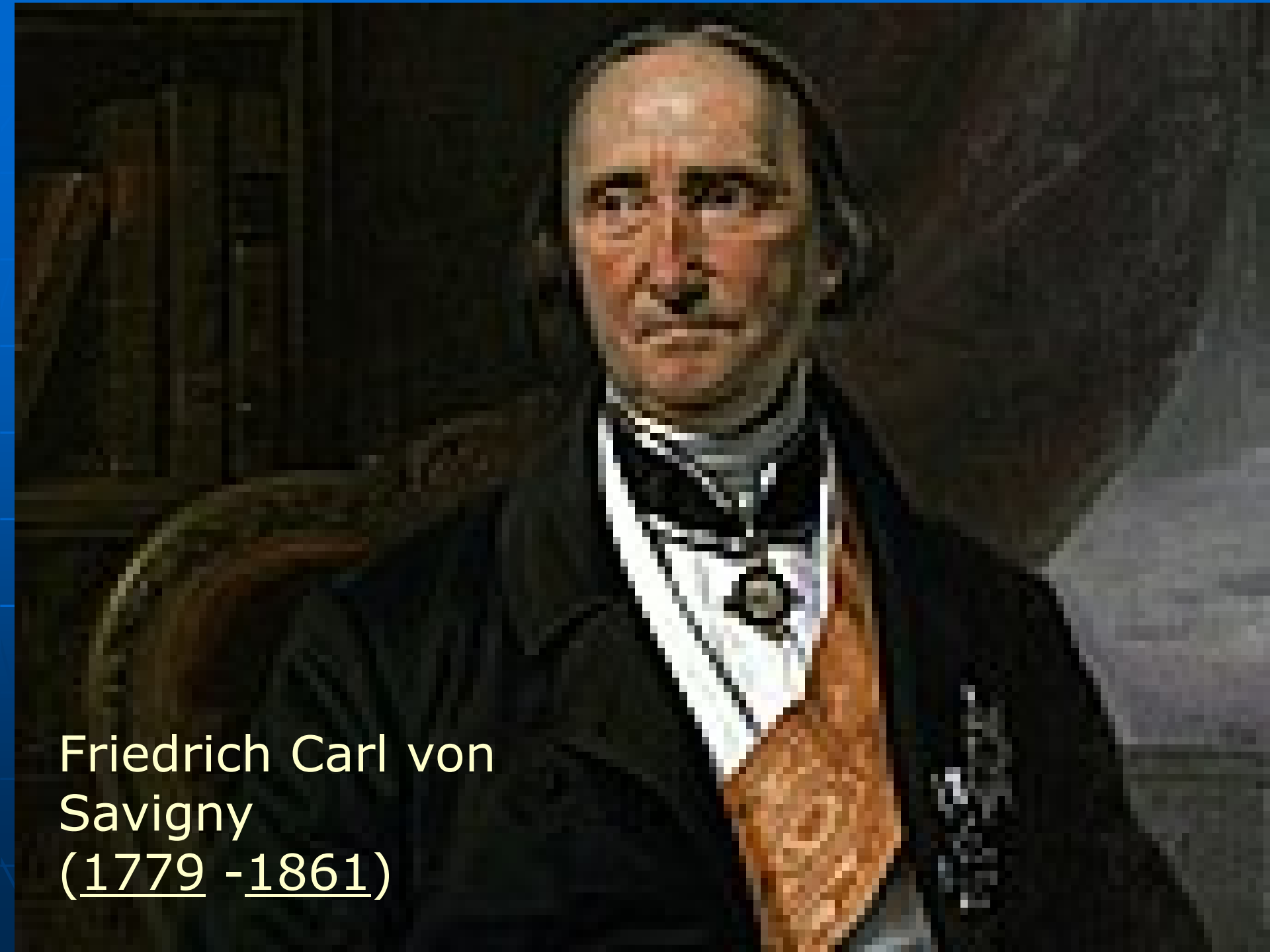
Friedrich Carl von Savigny ( 1779 - 1861 )