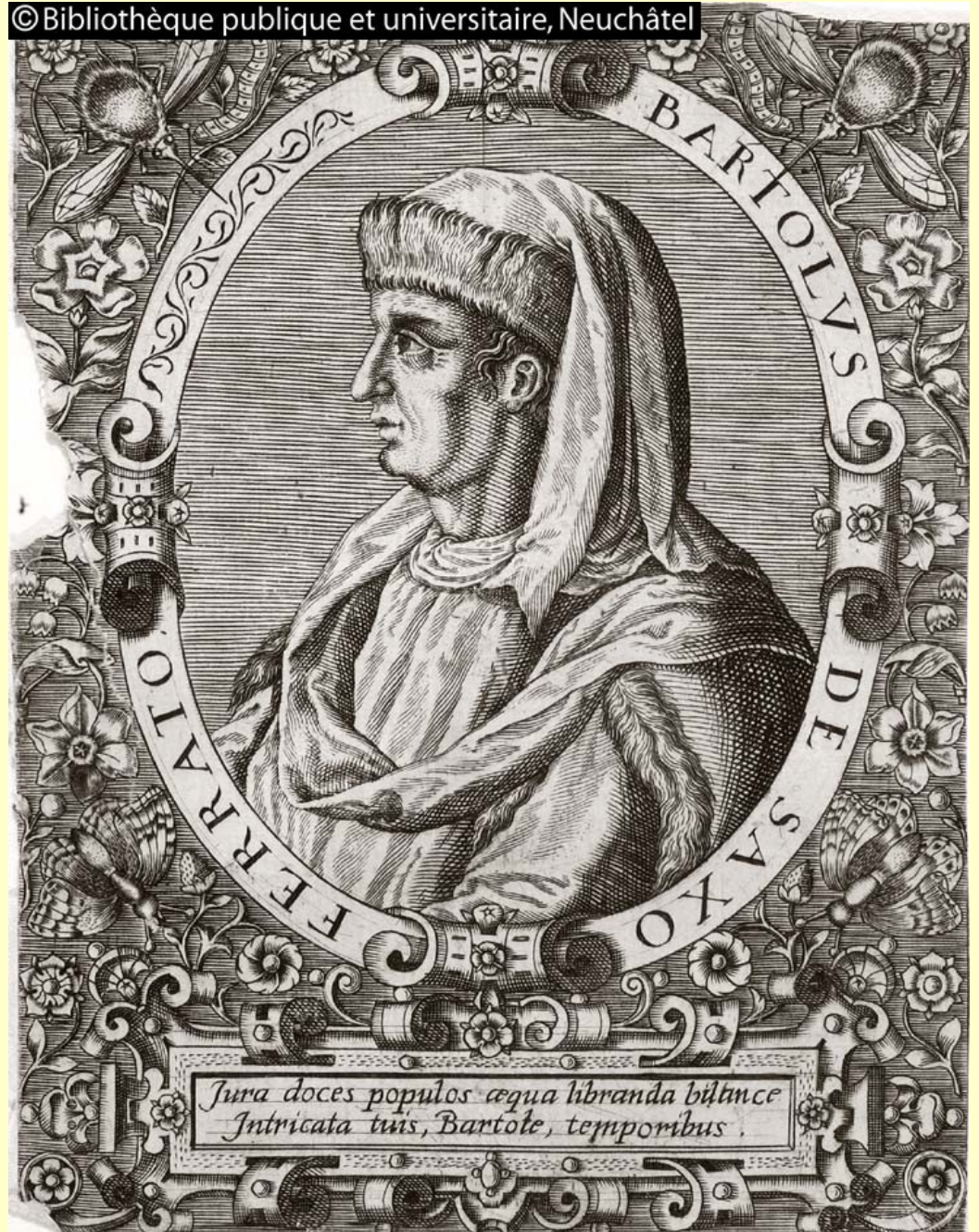
Bartolus de Saxoferrato