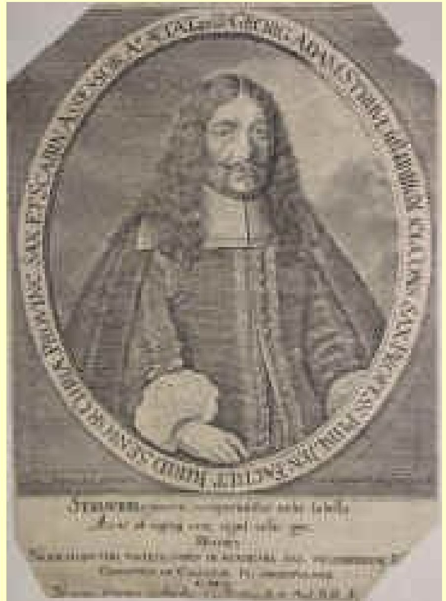
Georg Adam Struve