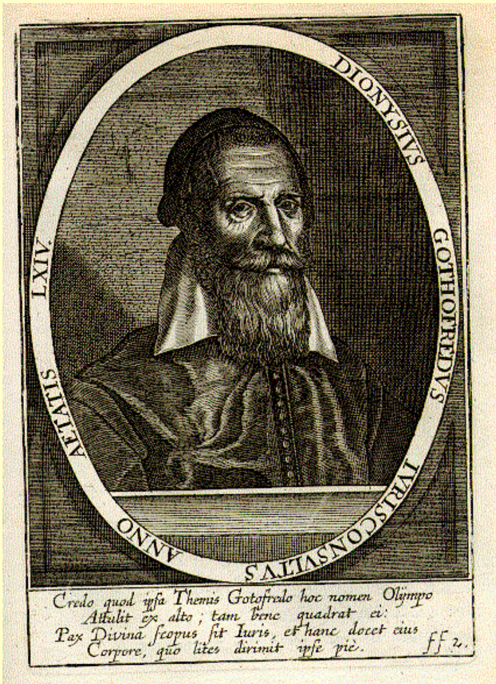
Dionysius Gothofredus (Godefroy, Denis) (1549-1622)