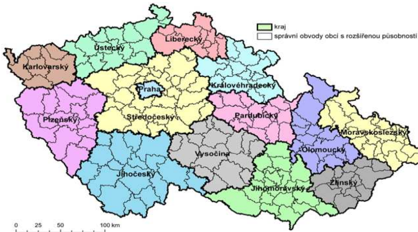
Územně správní členění České republiky