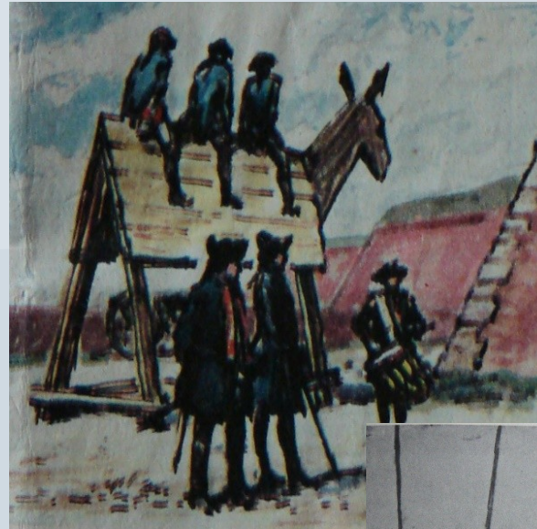
sezení na oslu, kresba G. Krumm

„running the guntlet“ - the soldier had to run among the soldiers with sticks who beat him, different number of runs (max. 36, later 2-10), the two rows formed 300 soldiers (150 at cavalry)