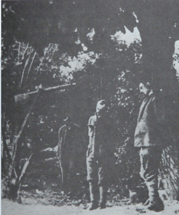
Above - Punishment of captured CZ-legionars ex-austrian soldiers on the front in Italy (Davonzo, 1918)