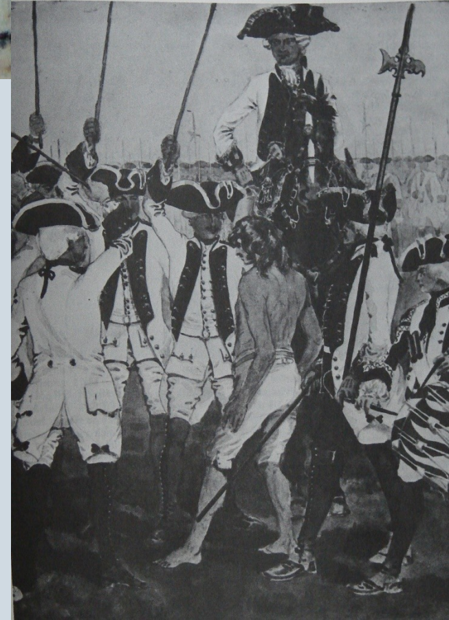
ulička u pluku Clerici, kol. vojenské dějiny Československa, Die Soldaten Marias Theresias