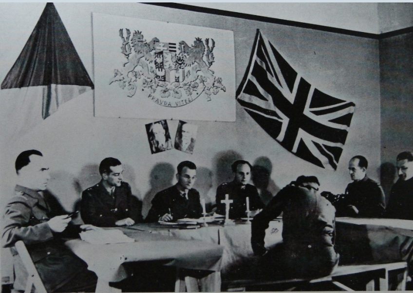
polní vojenské soudy I. instance ve Velké Británii a ve Francii, Czechoslovak military justice in Great Britain 1939-1945

Pictures: Cz military field trials in France and Great Britain during WW2)