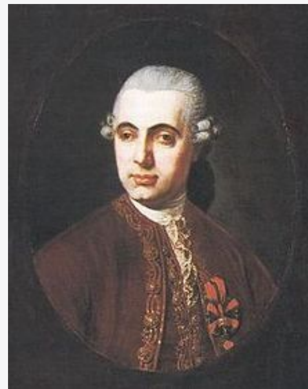
Karl Anton Martini (1726-1800)