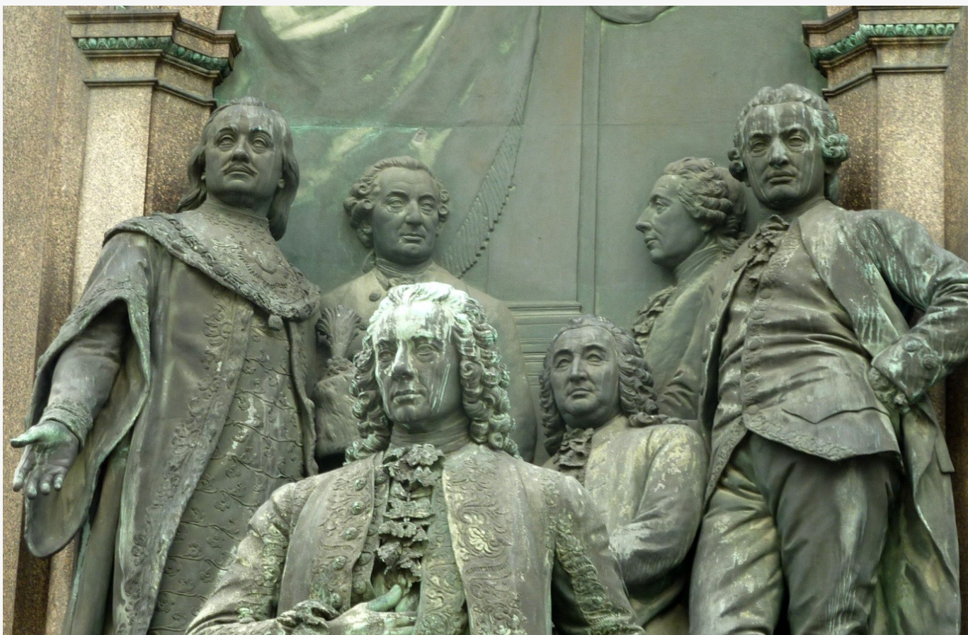
Pomník Marie Terezie, Vídeň (1888) Verwaltung und Justiz