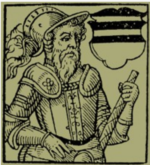
Hynek z Poděbrad (1452-1492)

„ein schöne iunckfraw ... pey czwelff iaren alte“ mění na