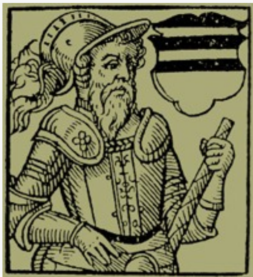
Hynek z Poděbrad (1452-1492)

„ein schöne iunckfraw ... pey czwelff iaren alte“ mění na