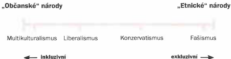
Graf 5.1 Názory na národ

To se týká „naturalizovaných“ přistěhovalců a nejvýrazněji se to projevuje v USA, „zemi přistěhovalců“. Plavba lodi Mayflower a americký boj za nezávislost dnes už většině Američanů mnoho neříkají, protože k oběma těmto událostem došlo dávno předtím, než předkové většiny současných Američanů přišli na území dnešních Spojených států.