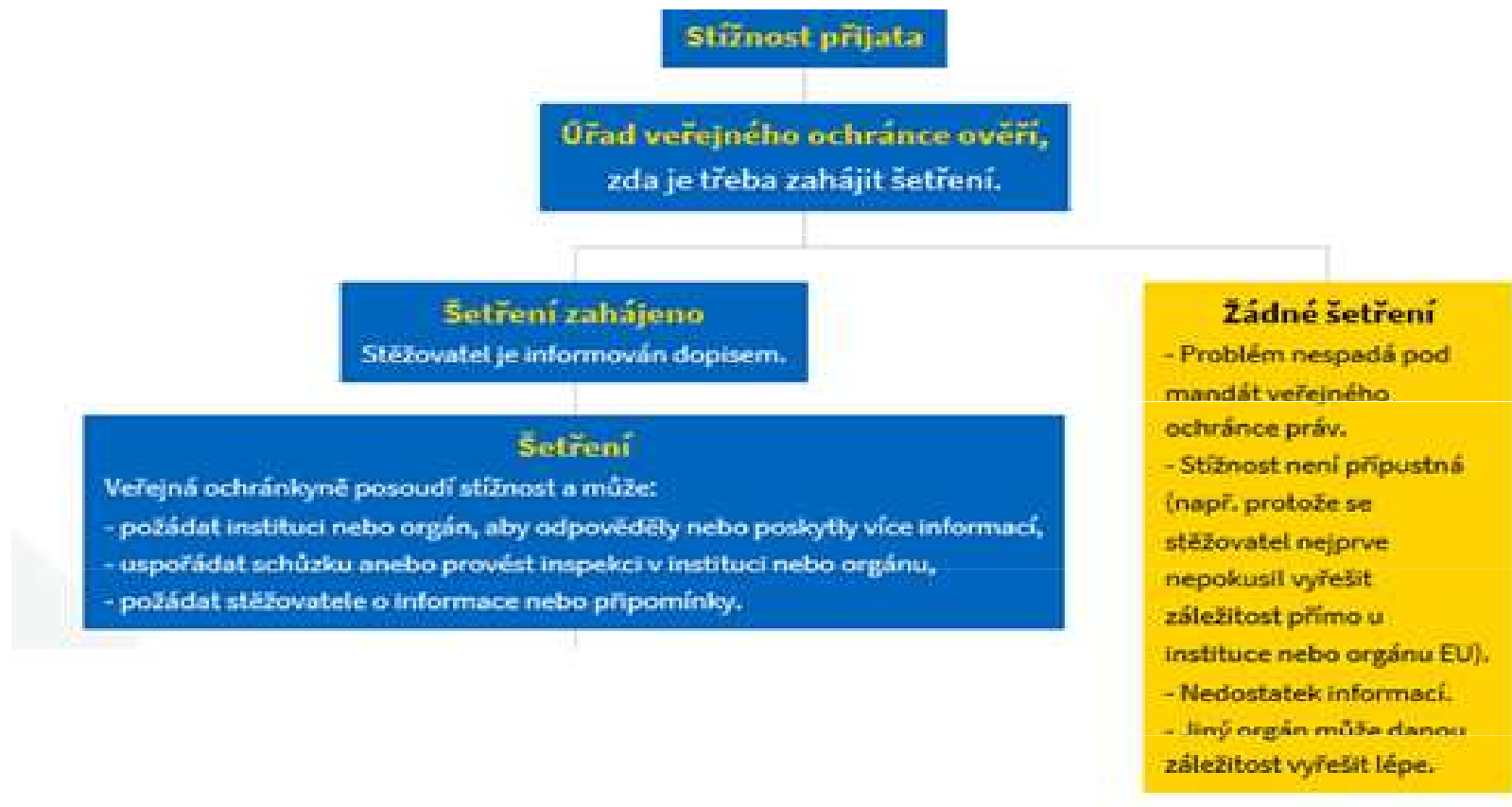
Schéma postupu při vyřizování stížnosti I