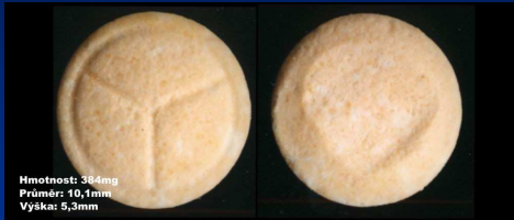
Hmotnost: 364mg Průměr: 10,1mm Výška: 5,3mm