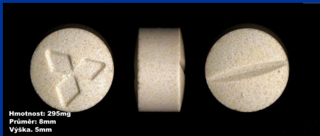
Hmotnost: 295mg Průměr: 8mm Výška: 5mm