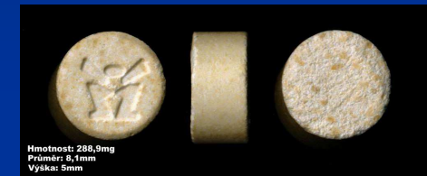
Hmotnost: 288,9mg Průměr: 8,4mm Výška: 5mm