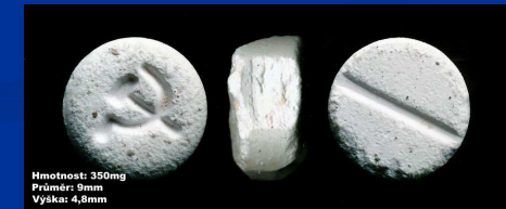
Hmotnost: 350mg Průměr: 9mm Výška: 4,8mm