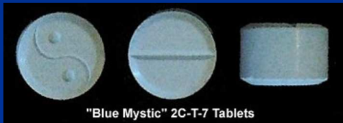
"Blue Mystic" 2C-T-7 Tablets