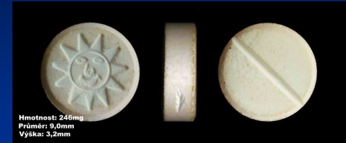
Hmotnost: 240mg Průměr: 9,0mm Výška: 3,2mm