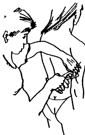
Kožní řasa nad tricipsem

Postup měření kaliperem: palcem a ukazovákem řasu v daném místě uchopte a tahem ji oddělte od svalů pod ní. Měřící plošky kaliperu umístěte druhou rukou za vrchol ohybu kůže (ve vzdálenosti cca 1 cm od prstů) a uvolněte měřidlo, čímž začne působit na kůži konstantní tlak. Tloušťku řasy v mm musíte odečíst do 2 sekund, doporučuje se ale pro zvýšení přesnosti měření opakovat.