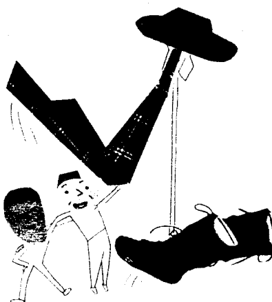
Ne, nikdo tam není.