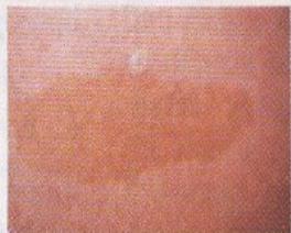
2. Café-au-lait spot