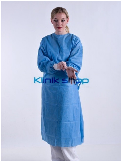
sterilní operační plášť