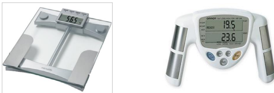
Obrázek 2: Bioimpedanční váha a ruční přístroj na měření biomimpedance

námaze (pocení) či dokonce u žen v době menstruace. Přístroje v praxi jsou dvou typů – ruční, který měří impedanci zejména v horní polovině těla a impedanční váha, která měří v dolní polovině těla (obrázek 2). Výsledky se tak mohou lišit kvůli různé distribuci tělesného tuku.