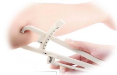
Obrázek 1: Měření tloušťky kožní řasy kaliperem

Více hodnot, které popisují aktuální stav výživy, dokáží přesněji odlišit některé fyziologické odchylky (způsobené např. vlivem hormonů) od již patologických. Dále dokáží rozlišit odchylky v tělesné konstituci organismu mezi mužem a ženou (způsobené vlivem pohlavních hormonů). Pro klinickou praxi má velký význam určení i dalších parametrů hodnocení stavu výživy, z nichž bychom na prvním místě měli jmenovat výpočet aktivní svalové hmoty a měření tloušťky kožní řasy. Tyto hodnoty lze zjišťovat v závislosti na vybavení pracoviště nejrůznějšími způsoby (diluční metody, spektrometrie, počítačová tomografie). Jsou ale velmi náročné na vybavení a mohou být nahrazeny v každodenní praxi metodami jednoduššími, které jsou pro běžnou klinickou praxi dostačující (kaliperem měřená kožní řasa (Obrázek 1), krejčovský metr pro stanovení obvodu končetiny nebo měření zastoupení tuku bioimpedanční metodou).