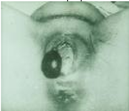
obr. 2: Scrotum při porodu KP