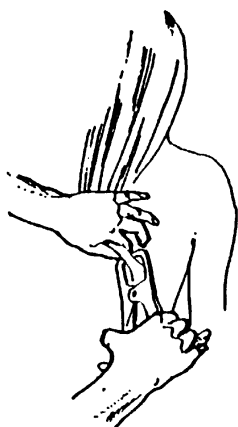
Kožní řasa nad lopatkou

Přehled standardních měřících míst je uveden na obr. níže. V praxi pro další možný způsob hodnocení zastoupení tuku v organismu z nich použijeme ještě měření kožní řasy nad lopatkou