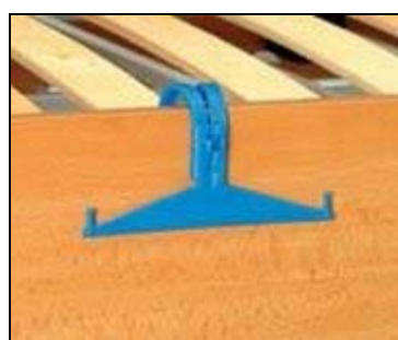
držák urologických sáčků