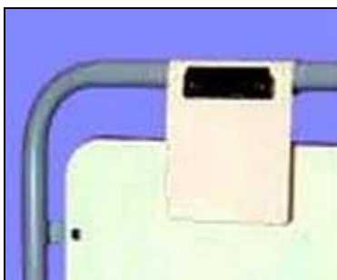
plastový držák na jméno