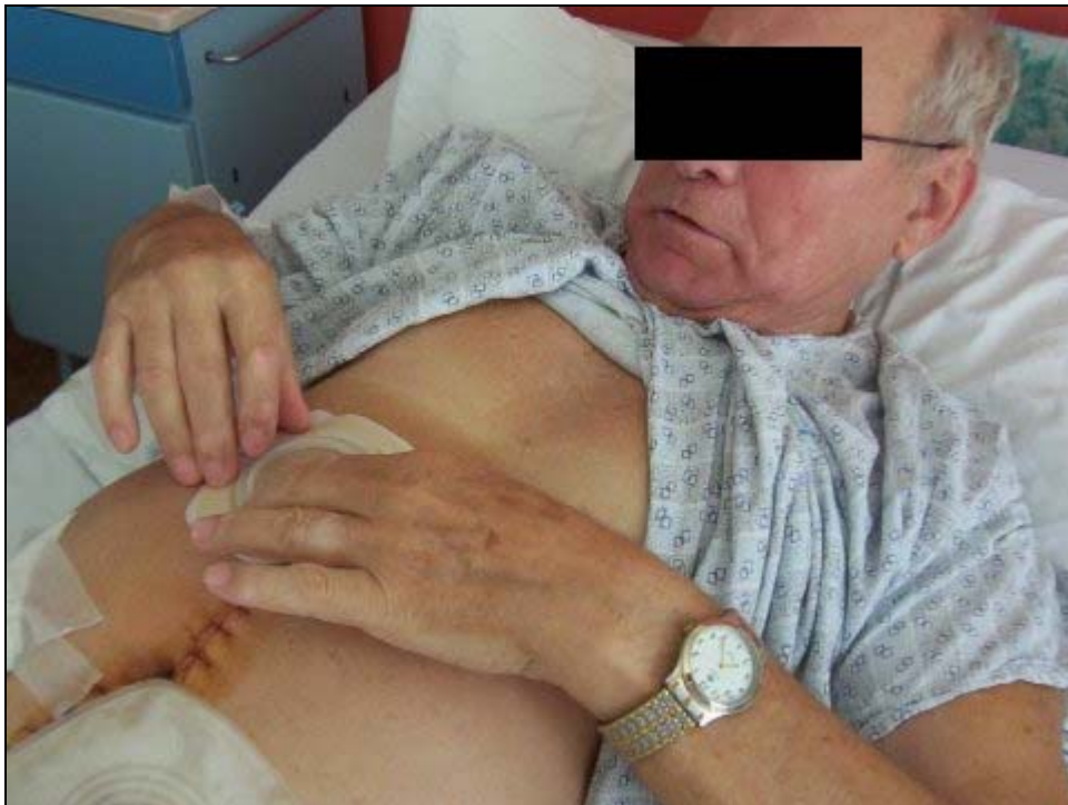
podpora nemocného v soběstačnosti