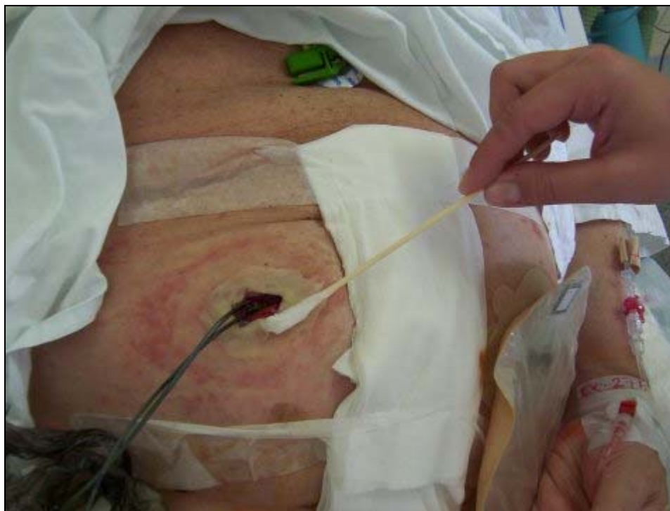
péče o okolí rány, prevence macerace