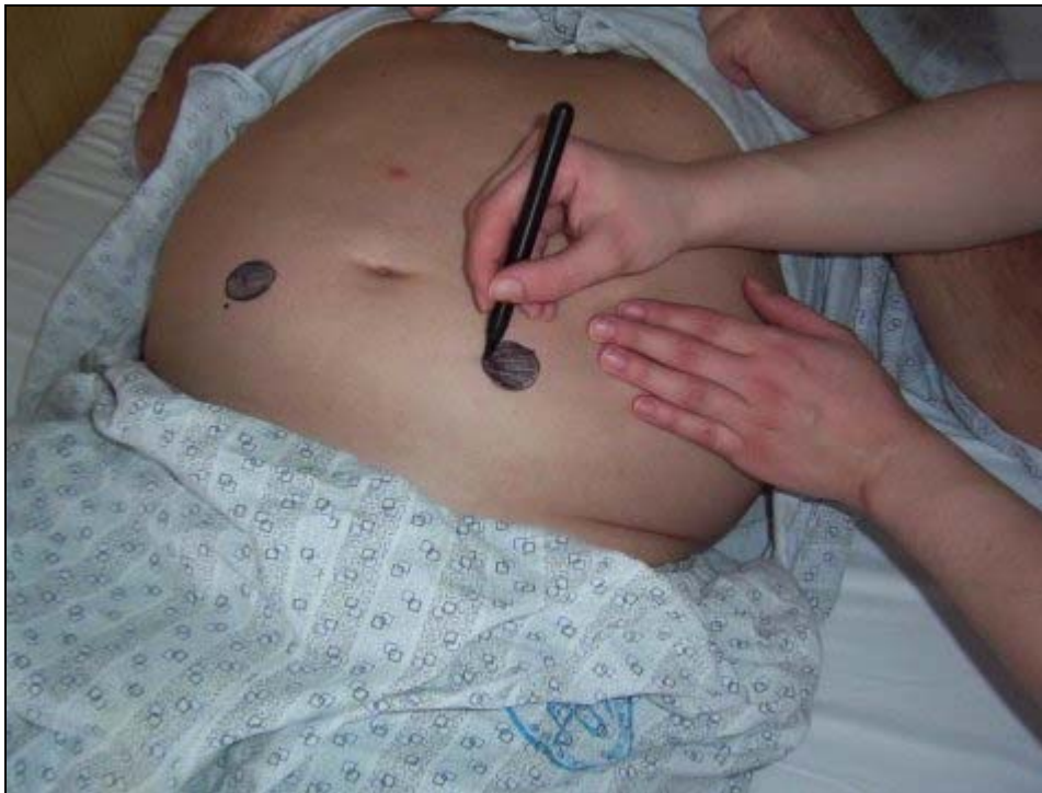
zakreslení umístění stomie