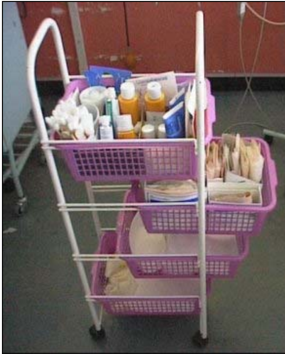
vozik se stomickými pomůckami na oddělení