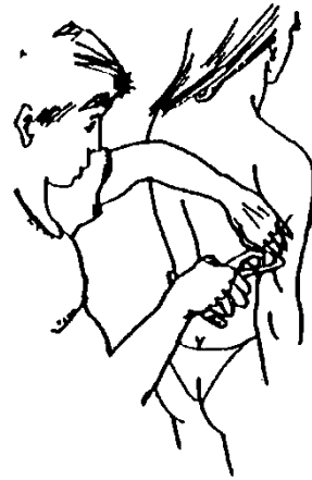
Kožní řasa nad tricepsem

Postup měření kaliperem: palcem a ukazovákem řasu v daném místě uchopíte a tahem ji oddělíte od svalů pod ní. Měřicí plošky kaliperu umístíte druhou rukou za vrchol ohybu kůže (ve vzdálenosti cca 1 cm od prstů) a uvolníte měřidlo, čímž začne působit na kůži konstantní tlak. Tloušťku řasy v mm musíte odečíst do 2 sekund, doporučuje se ale pro zvýšení přesnosti měření opakovat.