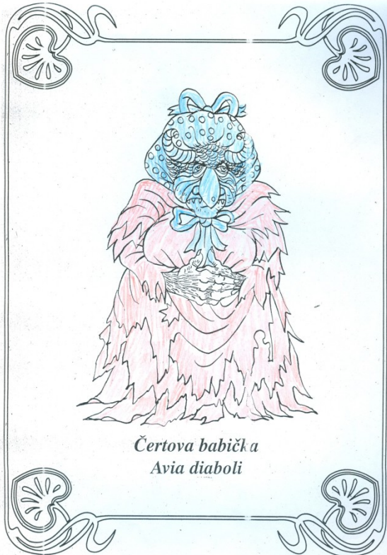
Čertova babička Avia diaboli