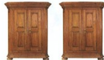
10. dva / dvě ..... skříně .....