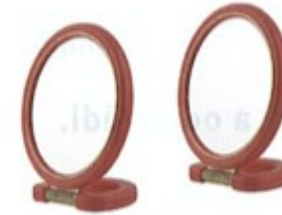
4. dva / dvě ..... zrcadla .....