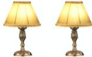
2. dva / dvě ..... lampy .....