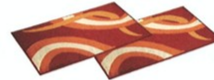
8. dva / dvě ..... koberce .....