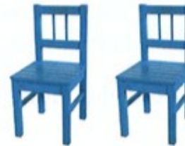
7. dva / dvě ..... židle .....