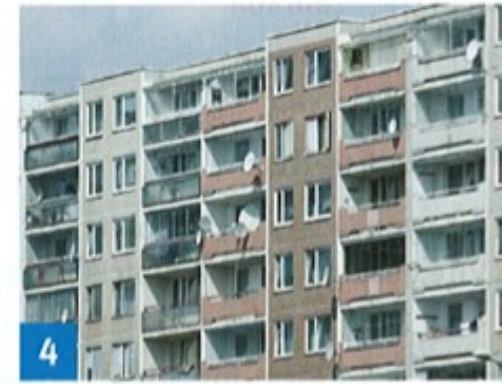
panelák (panelový dům)