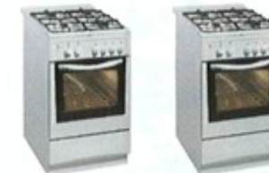
12. dva / dvě ..... sporáky .....