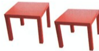
6. dva / dvě ..... stoly .....