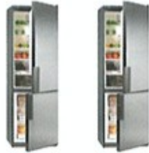
5. dva / dvě ..... ledničky .....