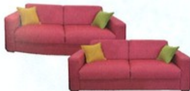
9. dva / dvě ..... sedačky .....