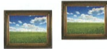
3. dva / dvě ..... obrazy .....