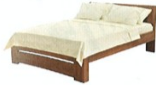
1. postel .....

skříň | koberec | postel | židle | křeslo | lampa | vana | stůl | lednička | sprcha | zrcadlo | kuchyňská linka | sporák a trouba myčka | obraz | pohovka/sedačka/gauč