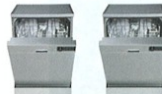
11. dva / dvě ..... myčky .....