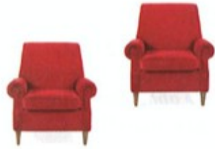
1. dva / dvě ..... křesla .....