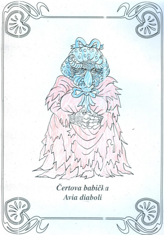
Čertova babička Avia diaboli